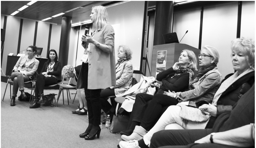
Während eines Tanzworkshops