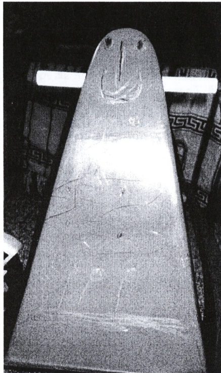
Abb. 2. „Ich-Symbol Schmetterling“

zu ermutigen. Sie hat kein ausreichendes Hungerbedürfnis. Es folgen dann viele Stunden, in denen Jennifer Kekse im Puppenofen aufbackt und ißt oder mit nach Hause nimmt.